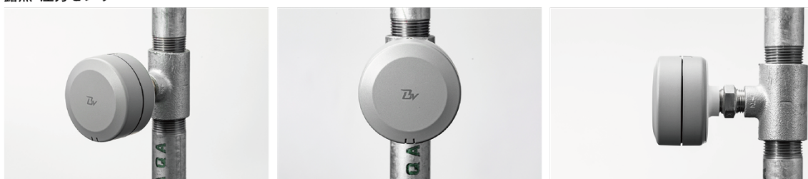
露点・圧力センサー